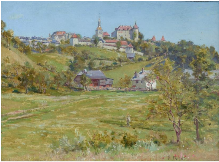
Vue de Gruyères , Francis Furet, non daté. Huile sur toile, 34 x 42 cm.

Ces trois œuvres sont décrites dans L'Ami du Musée , no 101, qui accompagne l'exposition Grâce à nos Amis – 50 ans d'acquisitions 1973-2024