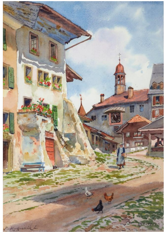
Vue de Gruyères , F. Huguenin, 18. Aquarelle sur papier, 59 x 48.5 cm.

Ces trois œuvres sont décrites dans L'Ami du Musée , no 101, qui accompagne l'exposition Grâce à nos Amis – 50 ans d'acquisitions 1973-2024