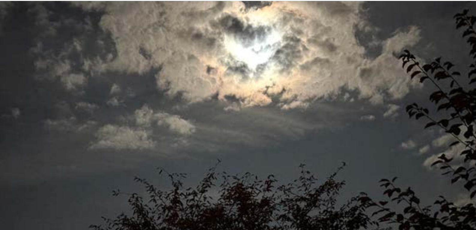
Pleine lune du 31 août 2023 dans le ciel fribourgeois.