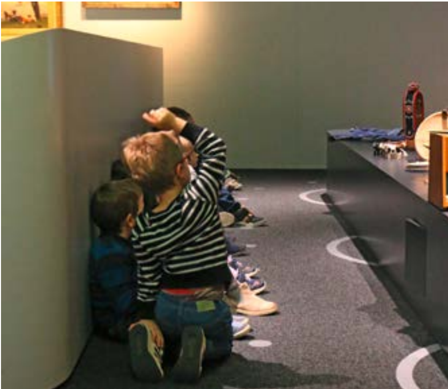
En avant la poya pour une classe de 2H, Festival Culture & Ecole 2018.