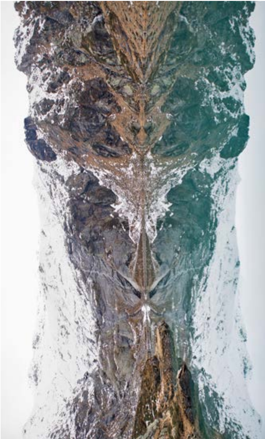
Je suis là et je te vois.

Ayant retrouvé mes lunettes, je me replongeai plus attentivement dans l'image et fus une seconde fois stupéfait d'y découvrir d'autres et innombrables présences. Le reflet du paysage