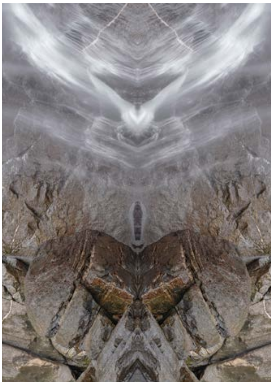
Tu étais sur notre chemin. © Daniel Pittet