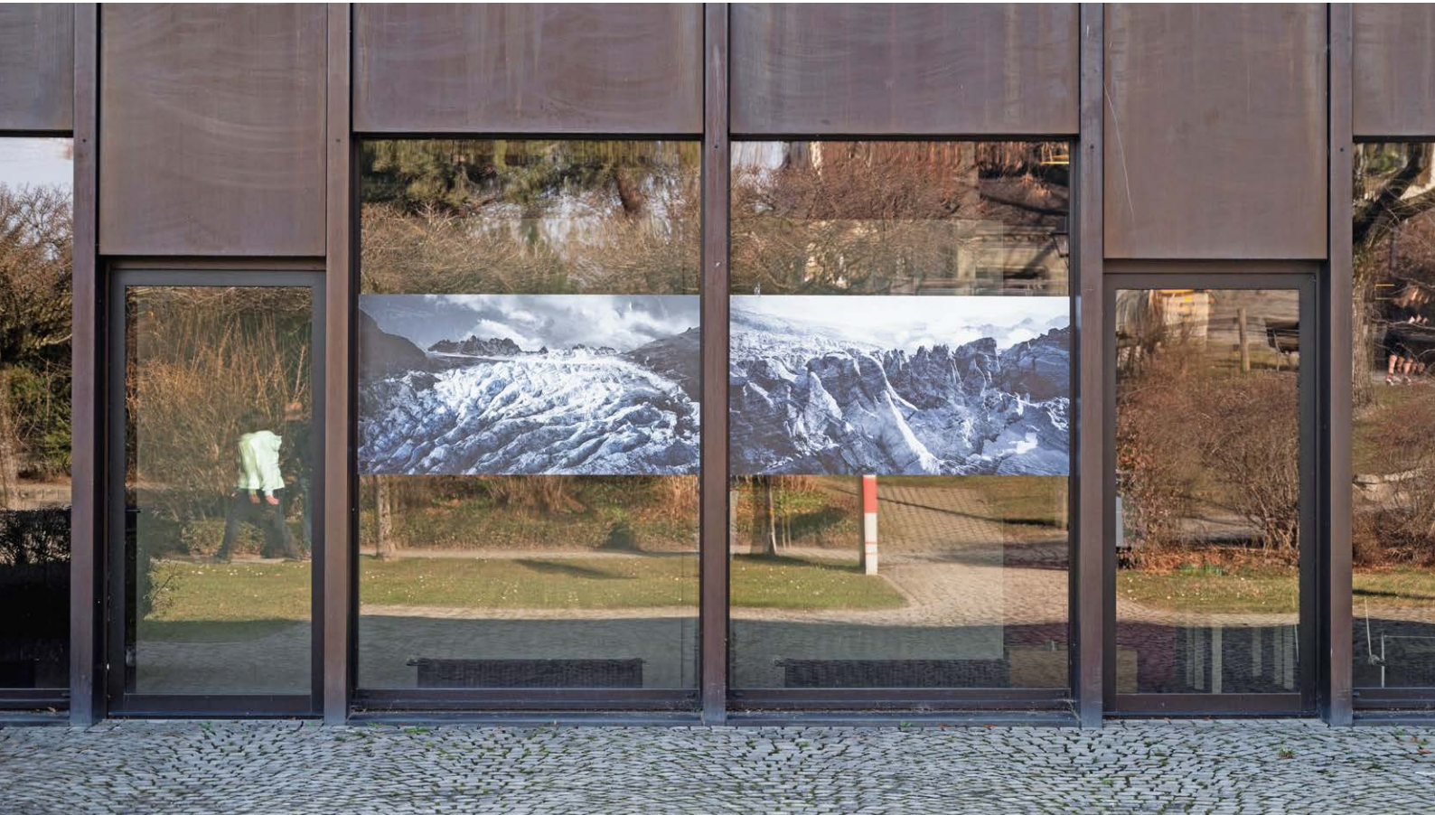
Deux photographies de Jacques Pugin affichées sur les façades du Musée gruérien