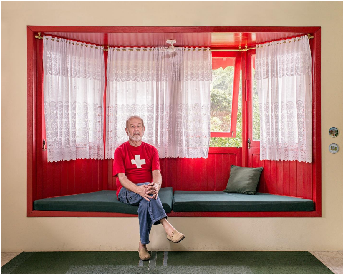
« A la Casa Suiça de Nova Friburgo ».