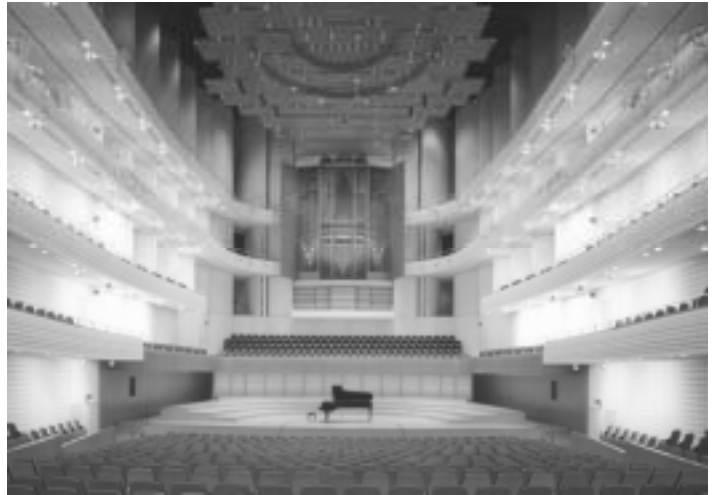
La prestigieuse salle du KKL qui attend 50 AMG le 15 juin