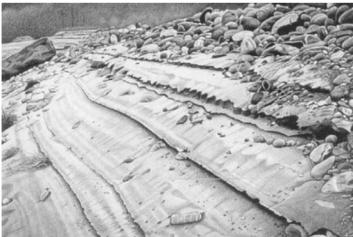
En haut, « Fribourg, le Pont du Milieu et Lorette ».