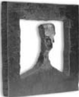
De David Dörig, cent visages en fer forgé massif

Dès le 15 septembre 2002, le Musée gruérien et l'association Form Forum Suisse présentent l'exposition «Métal - Metall - Metallo - Metal». Les 14 exposants retenus par un jury de spécialistes sont issus de la ferronnerie d'art, de l'orfèvrerie, de la mode et de l'art contemporain.